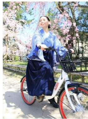
【シェアサイクル利用イメージ】